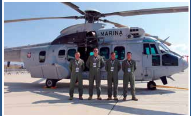
Eurocopter EC-750 Cougar de la Armada de México.