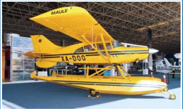
Maule M-7-260C presentado por Flymex