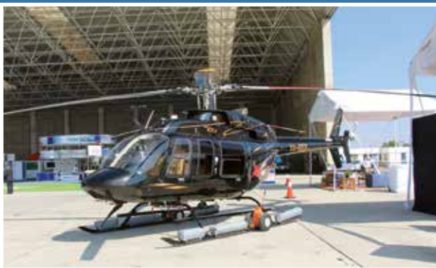
Bell 407 de Red Wings