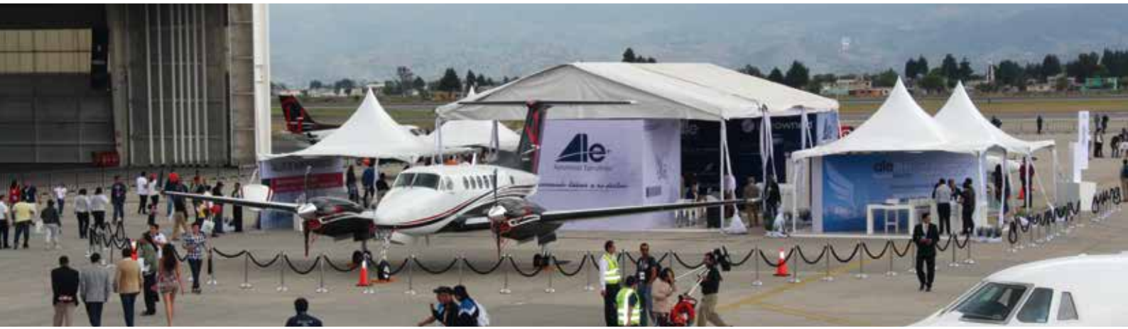
Beechcraft King Air 250 en la isla de Aerolíneas Ejecutivas, ALE