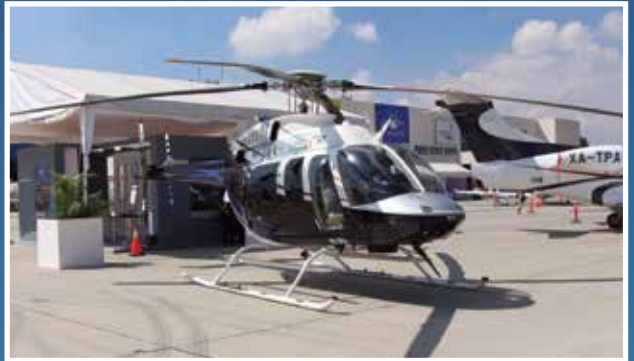
Bell 407 de Grupo Lomex