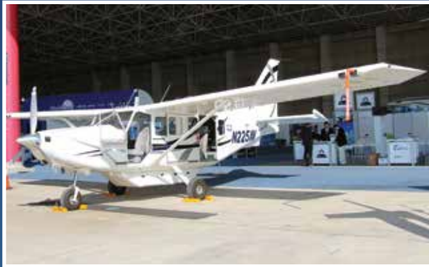
Gippsland GA8 Airvan